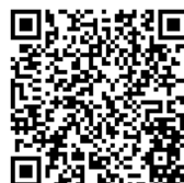
DIPS2.0 TOP ページ